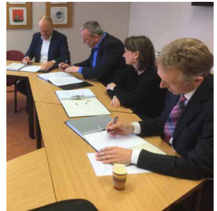
Ondertekenaars namens de gemeente Waterland, BPD Ontwikkeling BV, Hoorne Vastgoed Ontwikkeling BV en de Projectontwikkeling Galgeriet BV